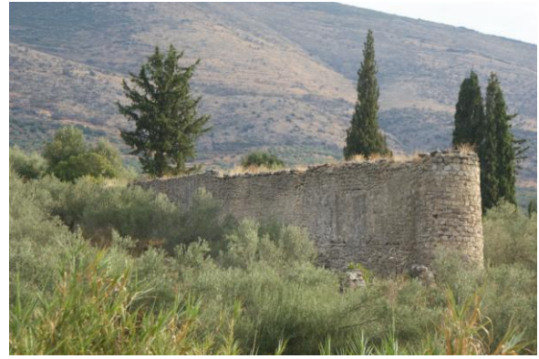
Hierboven een ruïne van een 'fall tower' en links een van een horizontale molen

En tot slot twee foto's bij onze eigen molen: