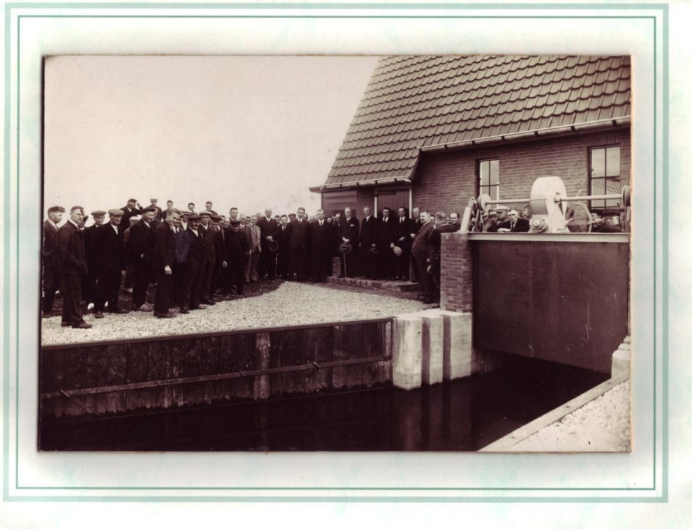
De foto van de ingebruikname van het gemaal. Wie kent nog iemand? En tot slot een sfeerbeeld: 10 december 2014